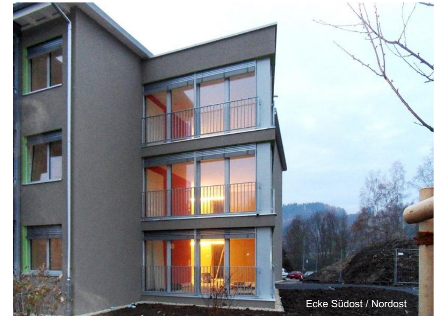
Ecke Südost / Nordost

Der Aufenthaltsraum im Nordosten lässt den Blick gegen die schöne Landschaft und in die Gartenanlage schweifen. Durch die Lage ausserhalb der direkten nachmittäglichen Besonnung ist der Raum auch im Sommer angenehm kühl. Zusammen mit den warmen, angenehmen Farben der Wände und des Mobiliars ergibt sich eine hohe Aufenthaltsqualität.