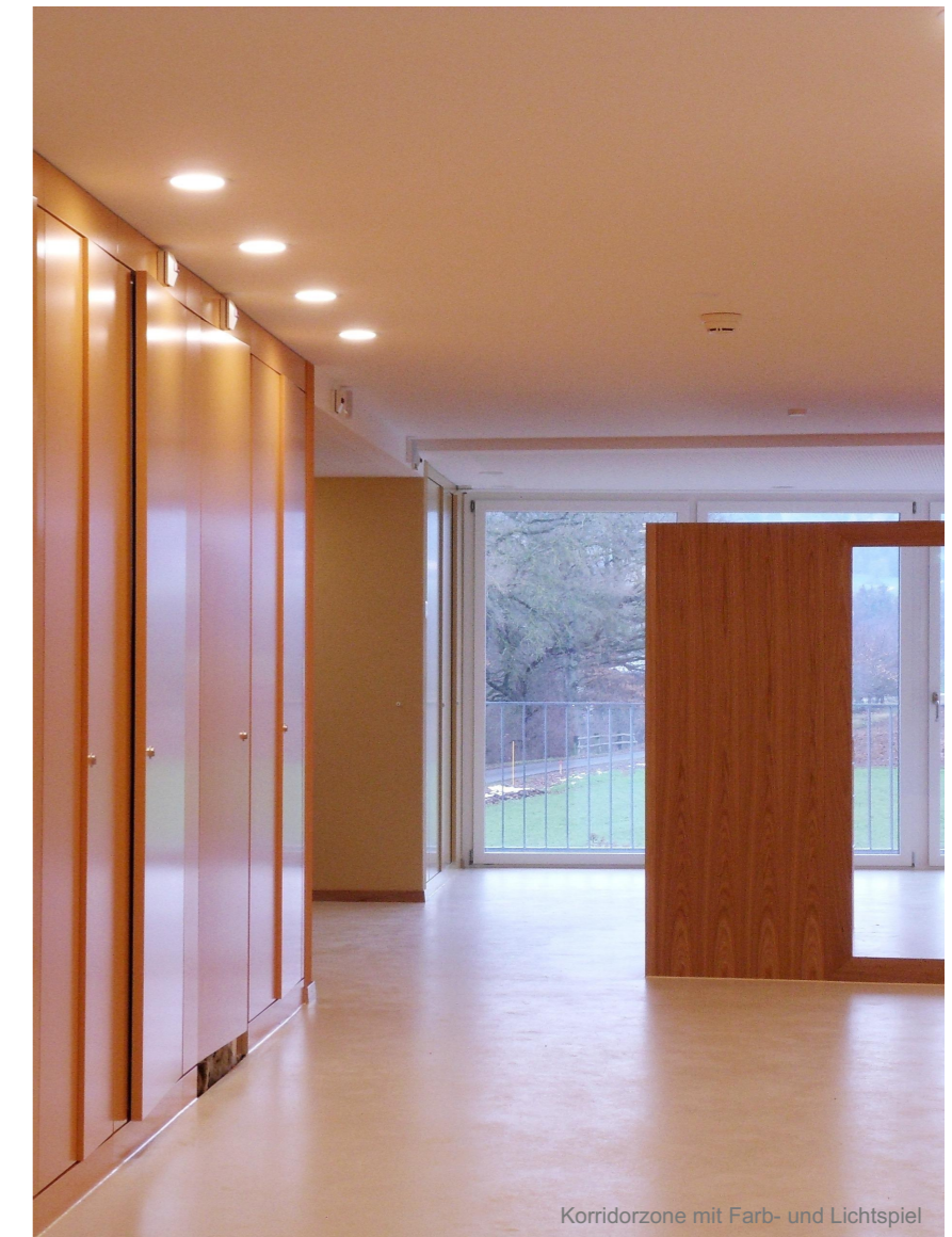
Korridorzone mit Farb- und Lichtspiel