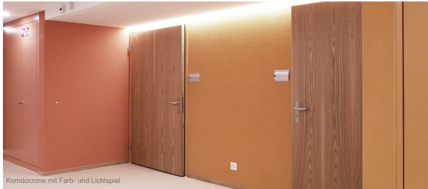
Korridorzone mit Farb- und Lichtspiel