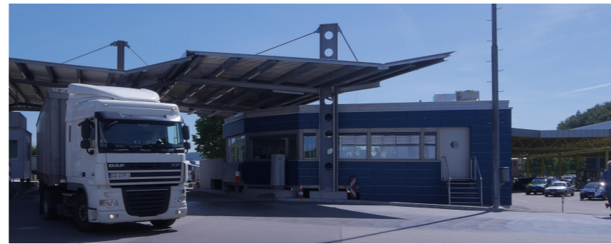
INTEGRATION IN DIE BESTEHENDE ANLAGE